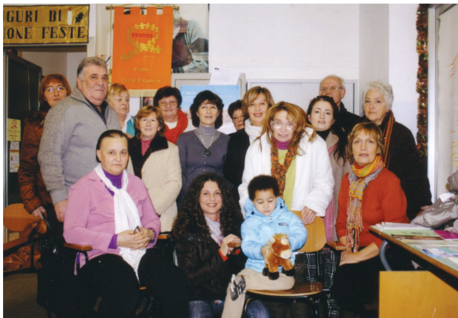
Foto di gruppo dei volontari Fevoss di Castel d'Azzano.

Nella sede di Castel d'Azzano, aperta tre volte alla settimana, vengono svolte attività mirate alla prevenzione e al superamento di problematiche di carattere socio-sanitario, mentre si organizzano visite domiciliari a persone sole e/o in difficoltà.