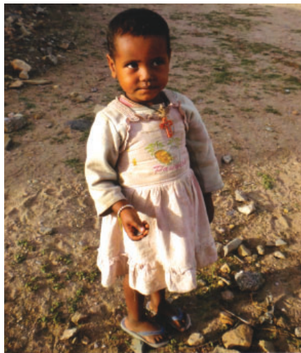
Come sarà il mio futuro?

Le donne africane hanno una dignitosa rassegnazione al loro destino, che più o meno è uguale per tutte: matrimonio precoce; molti figli per garantirsi che almeno qualcuno sopravviva alle malat-