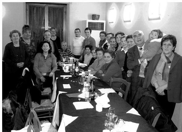
Il gruppo Fevoss "Noi per Voi".