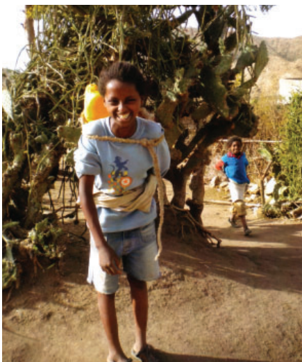
Giovane portatrice d'acqua.

Da piccole, già lavorano: portano l'acqua, raccolgono la legna, curano gli animali, accudiscono i fratellini, sostituiscono la mamma ammalata o impazita per la disperazione.